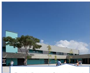
Escola Básica e Secundária de Salvaterra de Magos