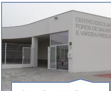
Centro Escolar de Foros de Salvaterra e Várzea Fresca